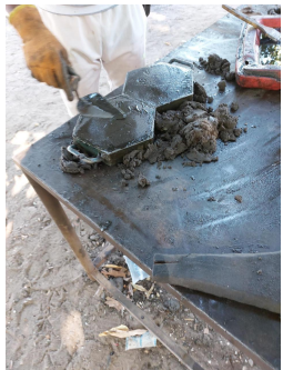
Het smeltende plastic wordt met zand gemengd. Daarna gaat het in een mal en wordt het stevig aangedrukt.