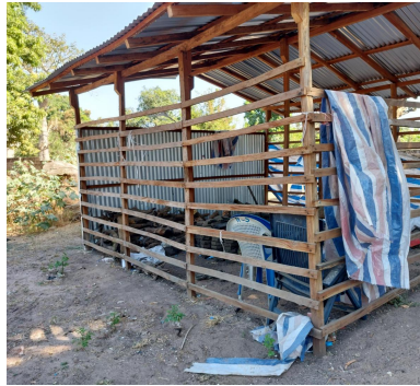
De werkmaterialen en het plastic worden in een hangar opgeslagen.