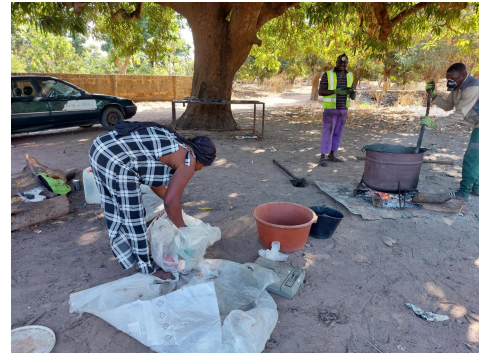
3 vrouwen sorteren en wassen het plastic. Nadat het gedroogd is wordt het gesmolten.