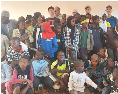
Bezoek aan lagere school