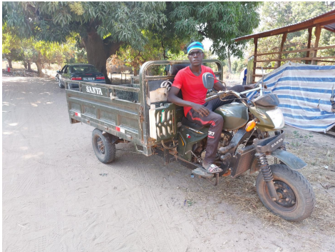
Het ingezamelde plastic wordt met de taf-taf naar de werkplaats gebracht.

Op zondag 29 januari brachten we een bezoek aan de werkplaats van het plastic recycling project omdat op die dag van het ingezamelde plastic plavuizen werden gemaakt.